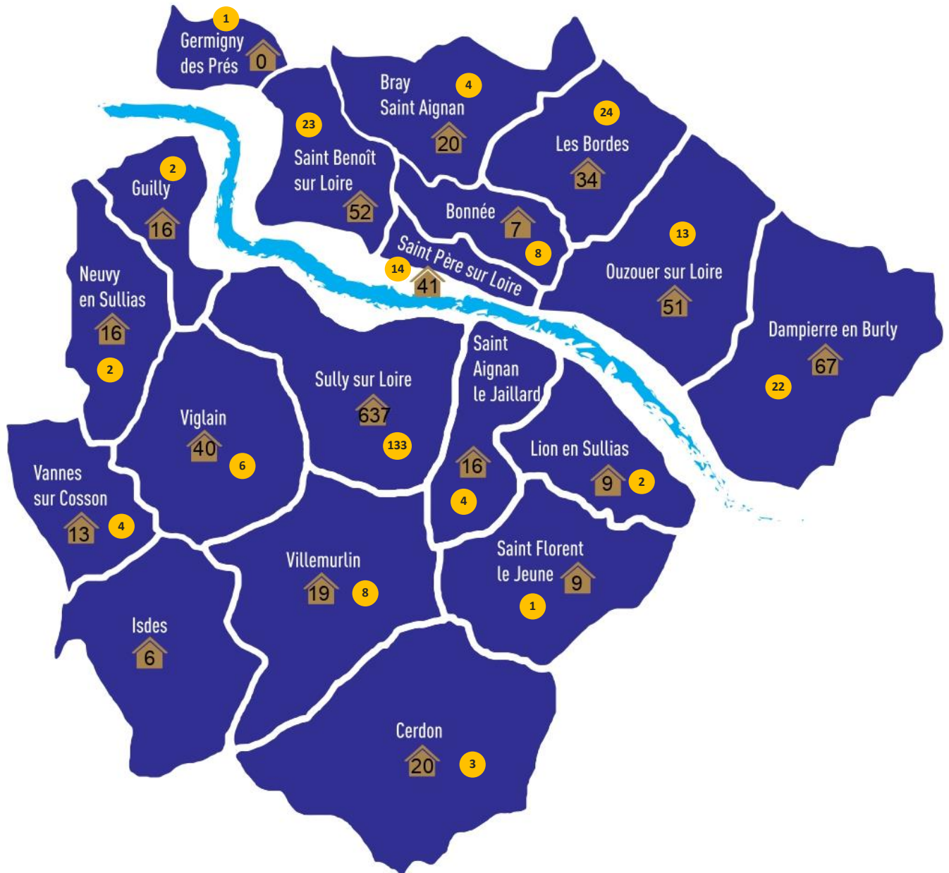
Répartition des logements HLM et de la demande par commune Année 2022