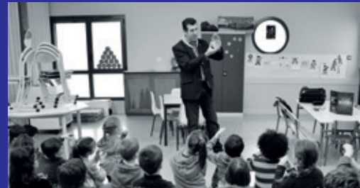
Scolaire. Théâtre Magique. 8 février.