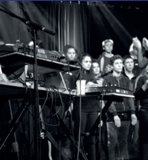
Collège. Musiques Actuelles. 19 janvier.