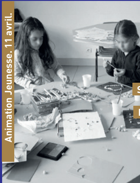
Animation Jeunesse. 11 avril.