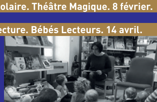
Lecture. Bébés Lecteurs. 14 avril.