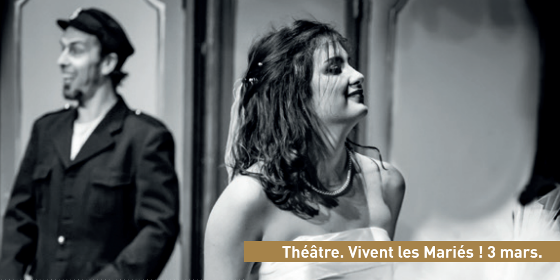
Théâtre. Vivent les Mariés ! 3 mars.