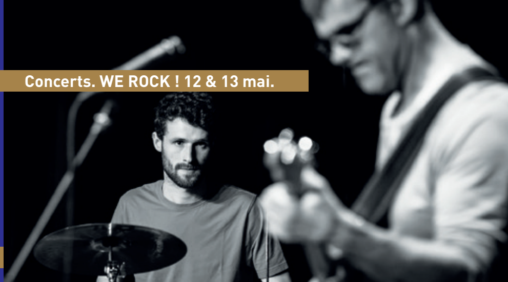
Concerts. WE ROCK ! 12 & 13 mai.