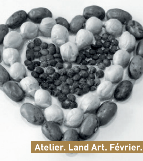
Atelier. Land Art. Février.