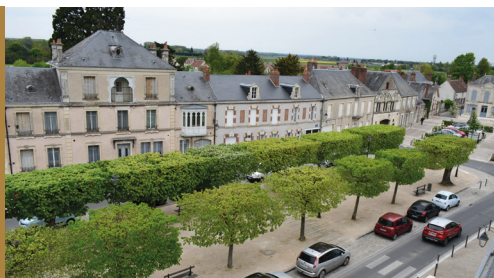
Aménagement du centre bourg Saint Benoît sur Loire