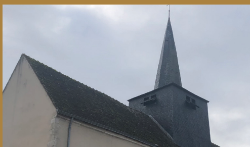
Réfection de la toiture de la sacristie Saint Aignan le Jaillard