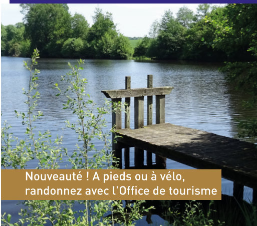
Nouveauté ! A pieds ou à vélo, randonnez avec l'Office de tourisme