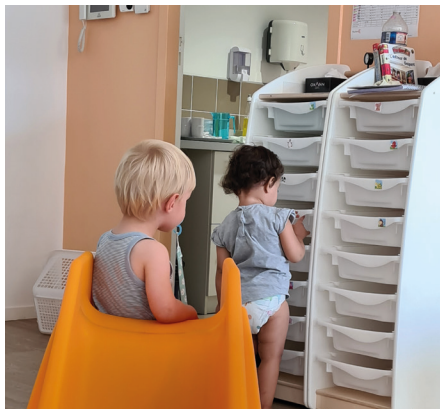
2021 : 1 ère année complète d'ouverture au multi-accueil à Ouzouer sur Loire

Les dépenses et recettes de fonctionnement sont les achats du quotidien et salaires. Par exemple, si nous comparons au budget d'un ménage nous pourrions assimiler ces postes respectivement aux dépenses liées aux courses et au versement de votre paye. Tous les services ont établis les budgets 2021 avec une économie de 10% sur les dépenses.