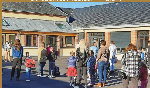
Travaux des écoles - Les Bordes