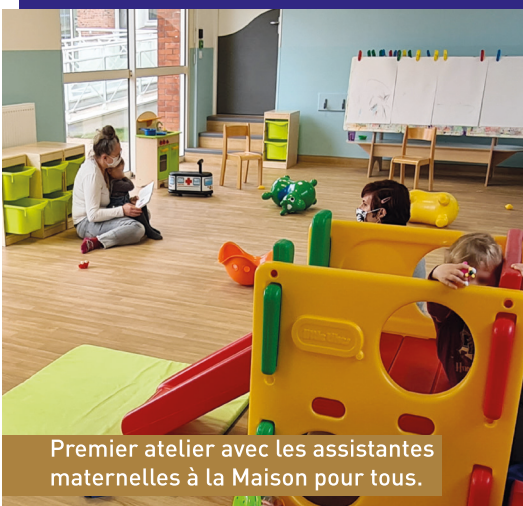
Premier atelier avec les assistantes maternelles à la Maison pour tous.