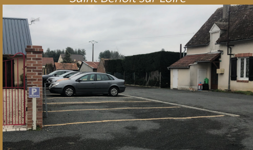
Sécurisation et d'accessibilité du cabinet médical - Viglain