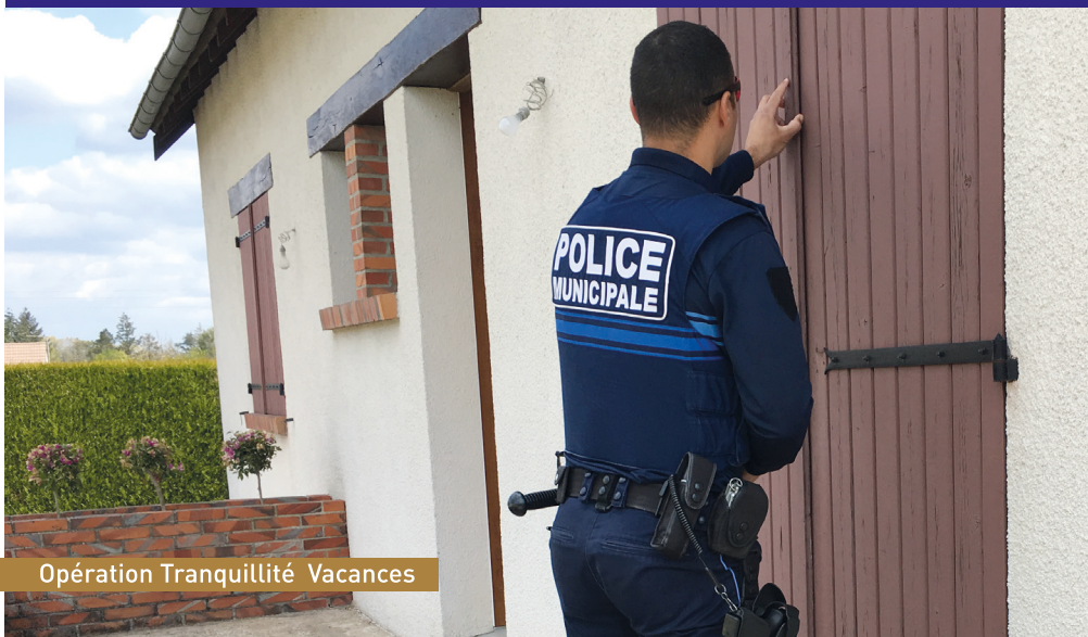
Opération Tranquillité Vacances