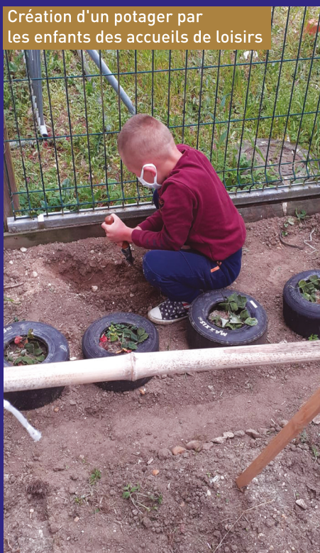
Création d'un potager par les enfants des accueils de loisirs